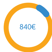
Convention ORS 14 000€ dont 20% comptés pour le département du Bas-Rhin au prorata de la démographie régionale soit 2 800€, ventilés à 70/30% entre ARS et CAF