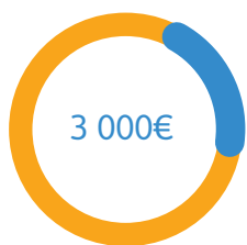
Guillaume CORDUAN Pédopsychiatre référent médical