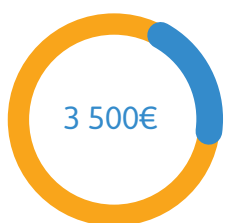
Convention CEMEA 25 000€ dont 20% comptés pour le département du Bas-Rhin au prorata de la démographie régionale soit 5000€, ventilés à 30/70% entre ARS et CAF