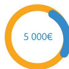
Communication (charte graphique, photos, bandeaux...)