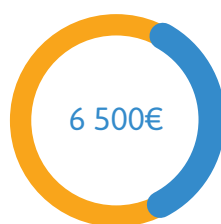
Quote part fonctionnement global MDA (temps direction inclus)