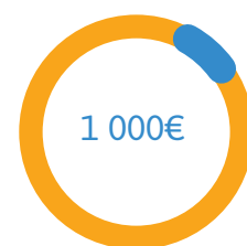
Documentations et formations