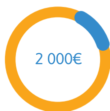
Frais de déplacement et de mission