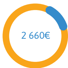
Et si j'avais tort (conceptualisation teaser studio vidéo photo)